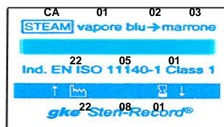
Etichetta adesiva con indicatore per